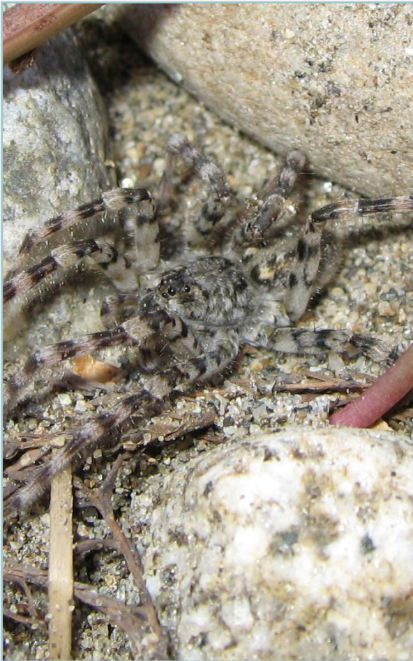
Arctosa cinerea i sitt naturlige miljø. Fargen kamouflerer edderkoppen svært godt.

er Rinnleiret, men denne lokaliteten må nok ses i sammenheng med Verdalselva like ved.