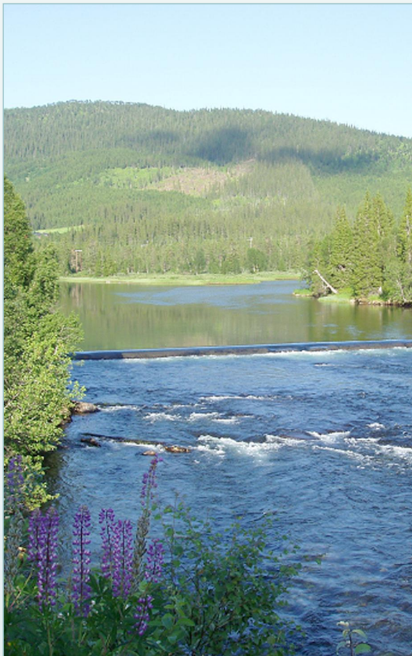
Småblank er en ferskvannsstasjonær laksebestand som finnes bare i Namsenvassdraget.

ikke vende tilbake til elva ovenfor fossen. Det ser imidlertid ut til at hunner som kjønnsmodnes i ferskvann oppstår oftere når sommertemperaturen i vannet er gjennomgående lav og veksten hos yngelen dårlig. Slike vanntemperaturer var det trolig i Namsen like etter siste istid, og temperaturforholdene kan ha vært gunstige for dannelsen av kjønnsmodne hunner. De kjønnsmodne hunnene var i stand til å overleve og formere seg ovenfor de nydannede fossene i Namsen, og ble dermed opphav til småblanken. Den ble trolig isolert fra vanlig, sjøvandrende laks for 9 500 år siden.