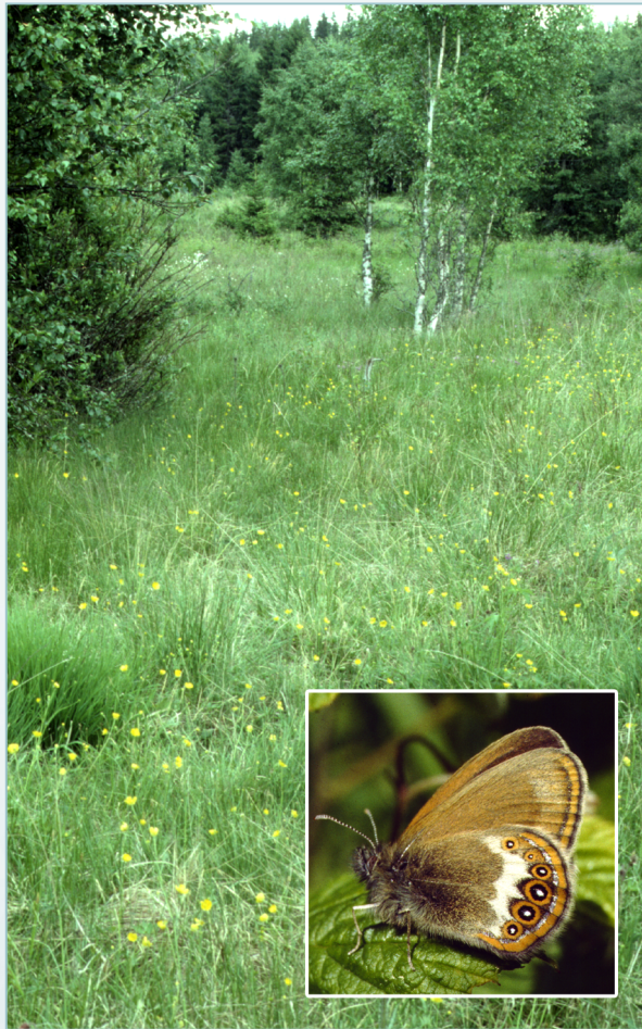
Slåtteng i skog er typisk habitat for heroringvinge.

med en generell tilbakegang i hele Europa. I Sverige er heroringvinge fortsatt ganske tallrik i Dalarna og Värmland, men arten har forsvunnet fra Skåne og har dødd ut i Danmark. Det er flere årsaker til artens tilbakegang i Norge. I Oslo og omegn er urbanisering den mest sannsynlige årsaken, og de få gjenværende leveområdene i indre Oslofjord er alle under stort utbyggingspress. Utenfor tettstedene skyldes tilbakegangen især tap av åpne, gressrike biotoper i skog på grunn av gjengroing, granplanting og nedleggelse av småbruk.